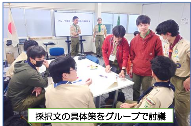
採択文の具体策をグループで討議

全国大会の提言文を受け、東京連盟のベンチャースカウトとして今後どのようなことに取り組むかを定めるため、グループ討議で課題を洗い出し、全体討議で東京連盟の共通課題を選定。「ゴミ問題」「地域交流」「ルール（交通、公園など）」が決まりました。