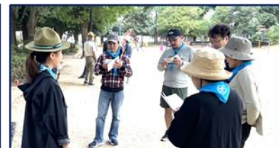
班集会：班長中心に技能を学び隊集会の準備 ロープワーク・歩測・読図・基本動作・ソングなど