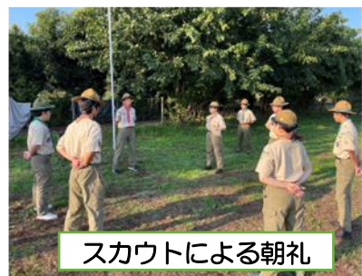
スカウトによる朝礼