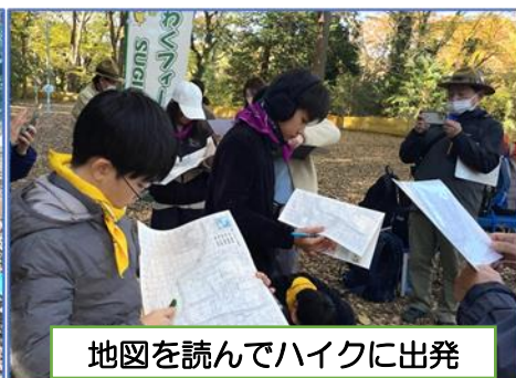
地図を読んでハイクに出発