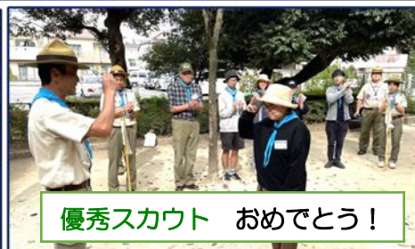
優秀スカウト おめでとう！