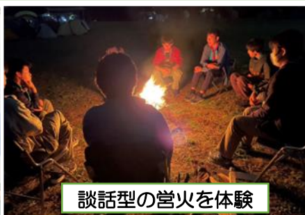
談話型の営火を体験