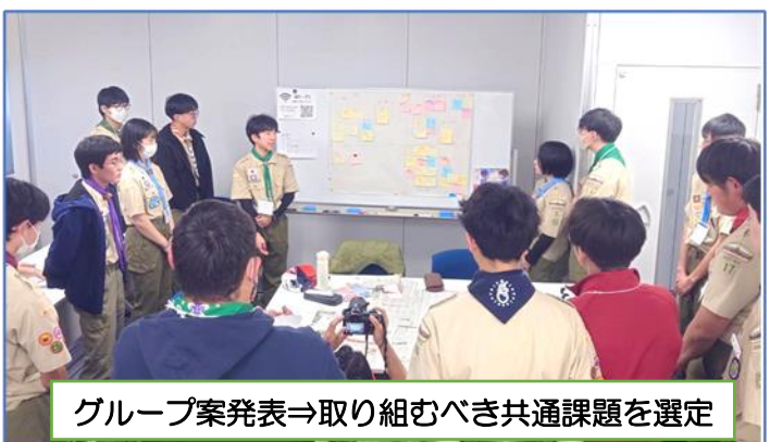
グループ案発表⇒取り組むべき共通課題を選定

今後、これら共通課題に沿った具体的なアクションプランを各地区で作成し、その実施報告を本年9月7日に行うことになりました。