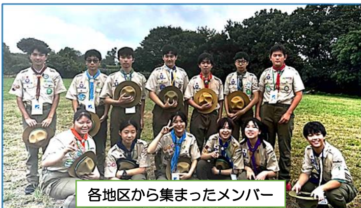
各地区から集まったメンバー

日本連盟の今年度テーマ「 高校生年代×地域社会～私たちからできること～ 」について各地区のベンチャーフォーラムで話し合った内容を報告。討議の結果「 既存の発想に捉われない高校生年代から出てくる企画によって、地域や世代間での交流を楽しみながら関りを深め、積極的に活動すると共に計画の充実性を追求する 」という採択文が決議され、全国大会で発表することになりました。