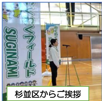
杉並区からご挨拶

わくわくフィールドSUGINAMI' 24 が、松ノ木小学校・スカウトの森（杉並13団）・和田堀公園で開催され、地区各団で協力し地域の子供たちにスカウト活動を応用した楽しい外遊びを提供しました。