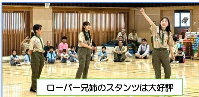
ローバー兄弟のスタントは大好評

ビーバー達は8つの混成グループに分かれて、各団で用意した5つのゲームコーナーを巡りました。楽しいゲームで大はしゃぎ、団を越えてビーバー達はすっかり仲良しになりました。