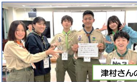
津村さんのチーム