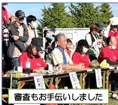
審査もお手伝いしました

ボーイスカウトあすなろ地区は、 設営撤営・駐輪場/場内警備・キッズコーナー運営 で例年お手伝いしています。前日の会場準備を含めて スカウト/指導者58名が奉仕 しました。