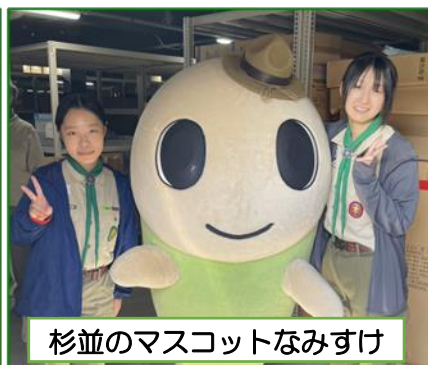
杉並のマスコットなみすけ