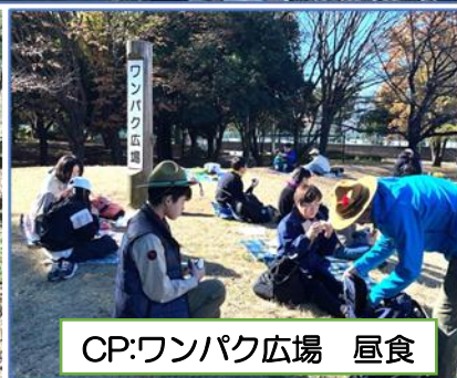
CP:ワンパク広場 昼食

スカウトの森で「火起こし体験」。地図でチェックポイント（CP）を確認してハイクに出発。和田堀公園を抜けてワンパク広場で昼食。午後は松ノ木小学校の体育館で救急法を学びました。