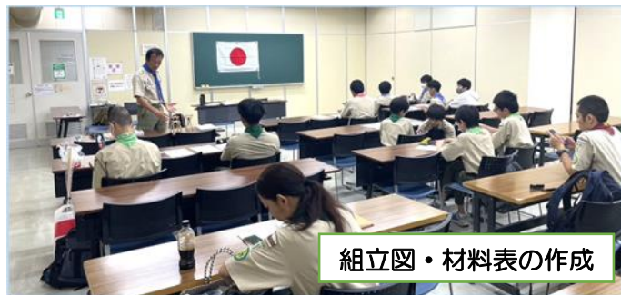
組立図・材料表の作成

中野ZEROで事前集会を行い、信号塔に必要な材料表と組立図を作成。模型作成の課題が出されました。