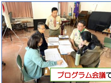
プログラム会議で活動のアイデア集め

今回の研究会では4個グループに分かれ、月次テーマに沿って「プログラム会議」でアイデアを集め、「リーダー会議」で活動展開を具体化。皆さん熱心に取り組み、ユニークな活動計画が出来上がりました。