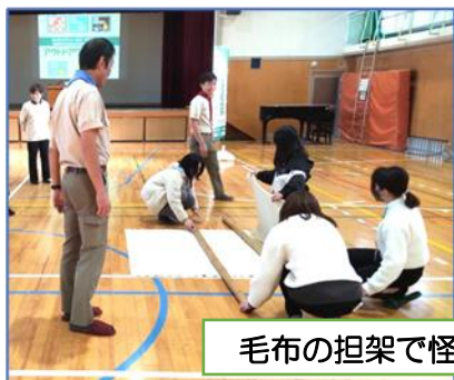
毛布の担架で怪我人を運ぶ