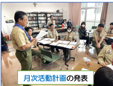
月次活動計画の発表