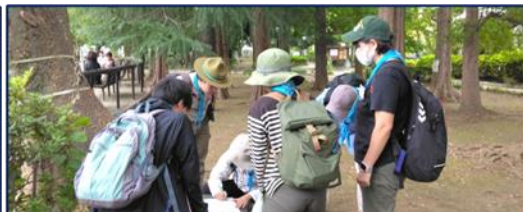
隊集会：ポイントを巡るハイキング 班集会で学んだ技能を活かしてチームワークで競い合う