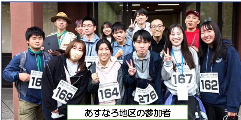
あすなろ地区の参加者

東京及び近隣の県連から254名のローバー年代が参加。あすなろ地区からは11名が100km先のゴールを目指してスタートし7名がゴールを果たしました。全体の完歩率は68.5%でした。