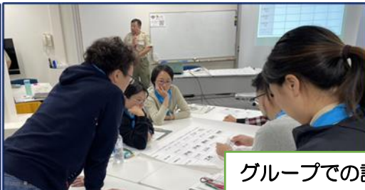
グループでの討議や発表