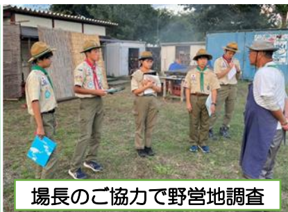
場長のご協力で野営地調査