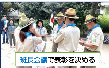
班長会議で表彰を決める