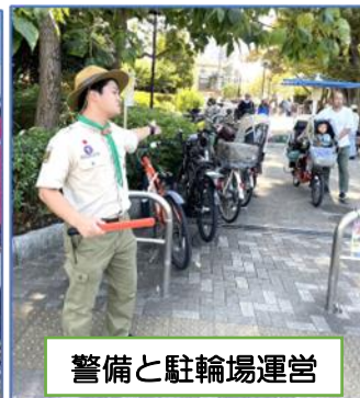
警備と駐輪場運営