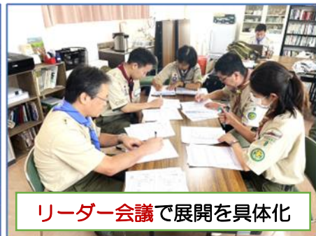
リーダー会議で展開を具体化