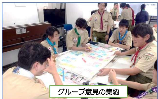
グループ意見の集約

全国大会の提言文を受け、東京連盟のベンチャースカウトとして今後どのようなことに取り組むかを定めるため、グループ討議で課題を洗い出し、全体討議で東京連盟の共通課題を選定。「ゴミ問題」「地域交流」「ルール（交通、公園など）」が決まりました。