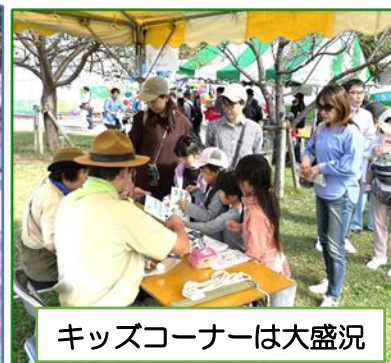
キッズコーナーは大盛況