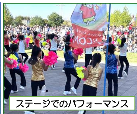
ステージでのパフォーマンス