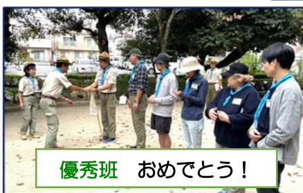
優秀班 おめでとう！