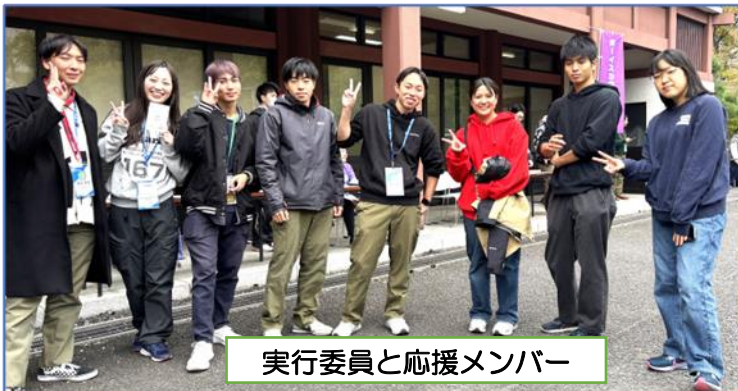
実行委員と応援メンバー

歩き始める時は少し不安でしたが、皆さんの励ましで歩き通すことが出来ました。100キロハイクを通じて過酷なチャレンジに成功できた自分に自信が持てました。支えてくれた仲間には感謝しかありません。