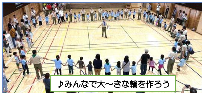
♪みんなで大～きな輪を作ろう

10月6日（日）中野第一小学校に、体験参加を含めBVS60名と保護者30名、スタッフ50名が参集し「あすなろビバリンピック2024！」（地区ビーバーラリー）が開催されました。