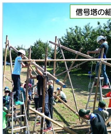
信号塔の組み立て